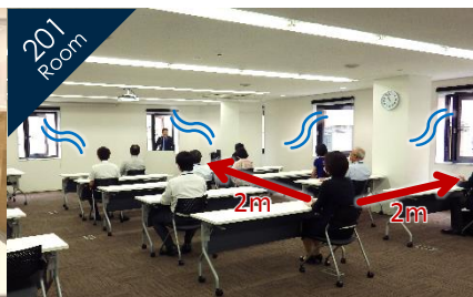
席同士の距離2m以上でソーシャルディスタンスを確保 / 窓を開けて換気対策をしています