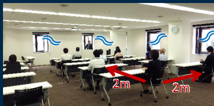
▲ 席同士の距離2m以上 / 窓を開けて換気