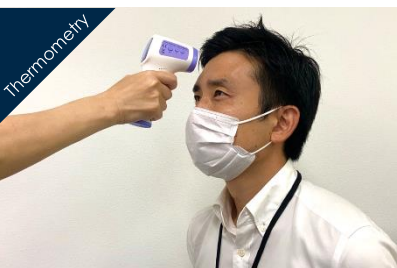
部屋に入る前に非接触検温をします

アイデアホリック会議室 神保町 ideaholic conference by JPS Jimbocho