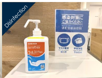
手指の消毒液を設置しています