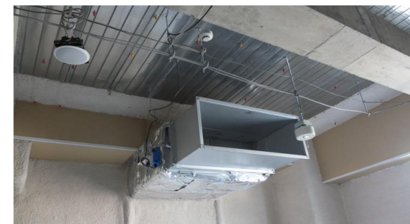
▲ 強力な排気用ダクト設備