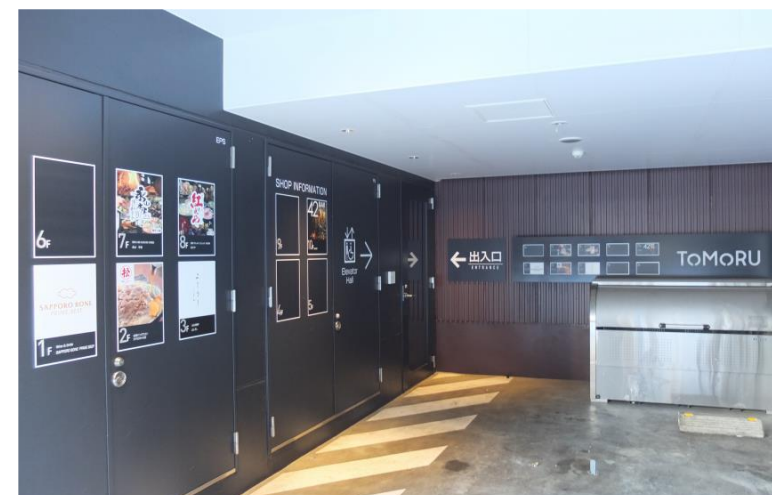
▲ ビル裏にもお店の案内看板があります