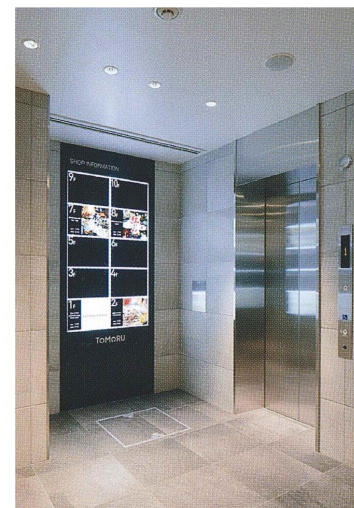
1F エレベーターホール