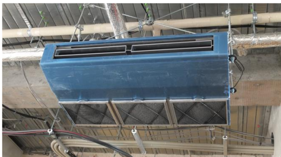
▲ 厨房用の冷暖房機 2 台設置