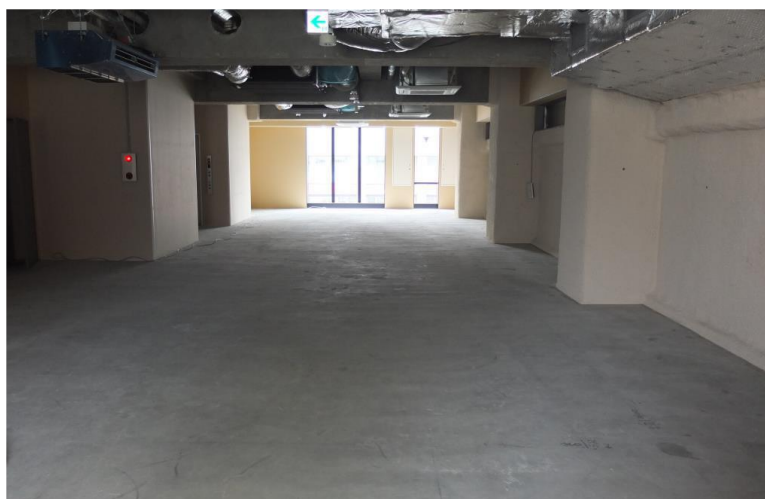
▲ スケルトン状態の内部