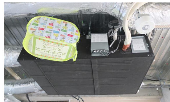
◀ 冷暖房の熱を利用する熱交換機