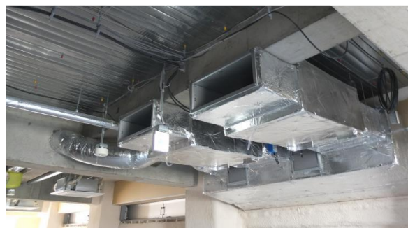
▲ 吸気用ダクト設備