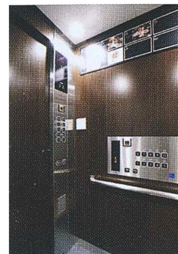
エレベーター内部