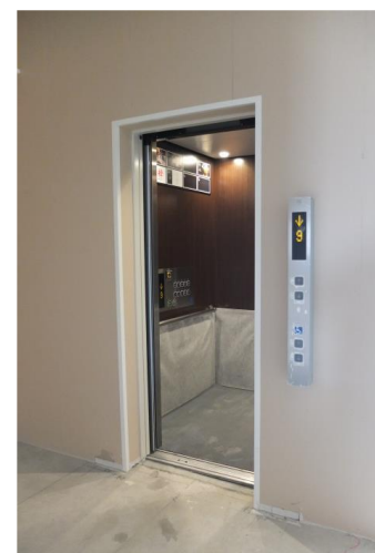
▲ 内部のエレベーター（2基）