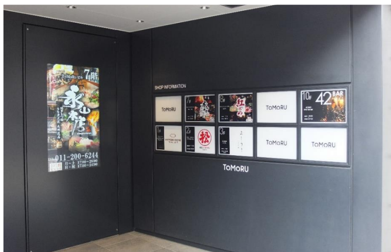
▲ ビルのエントランスには、写真入りの看板を設置