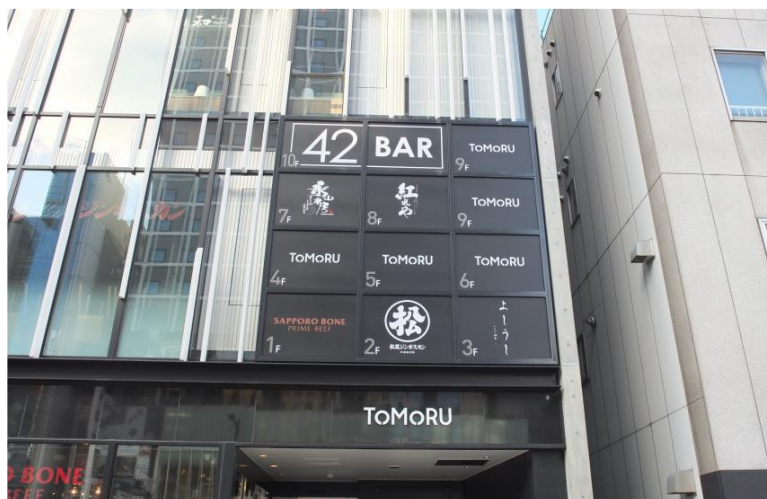
▲ 正面の大型看板が通行人の目を惹きます