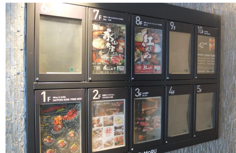
▲ 1階エレベーター前の案内板です