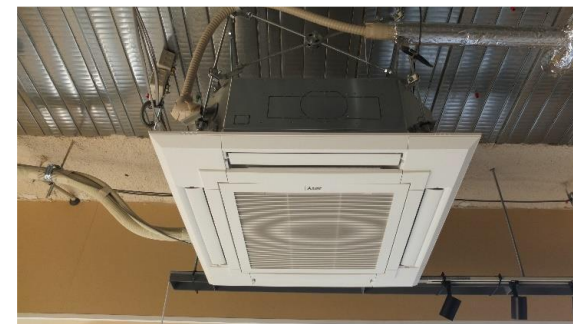
▲ 客室用冷暖房機 3 台設置