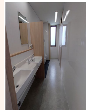
【男子トイレ】2025年改装済