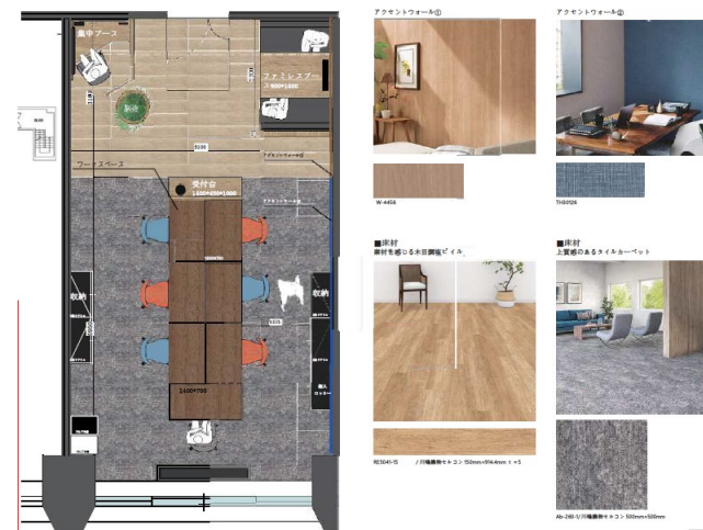
セットアップオフィス平面図