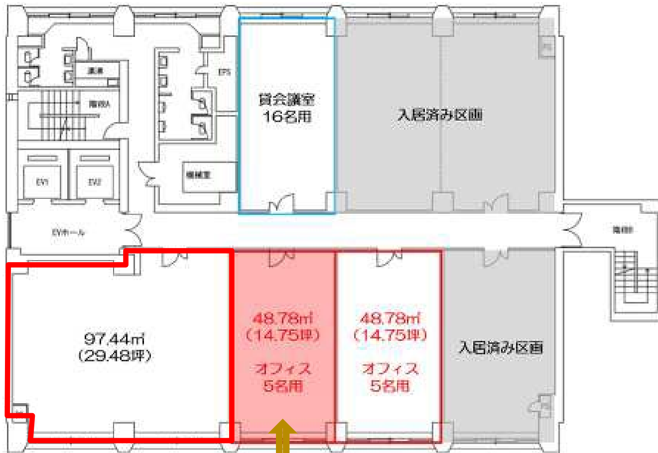
セットアップオフィス該当区画