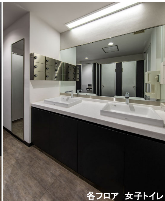
各フロア 女子トイレ