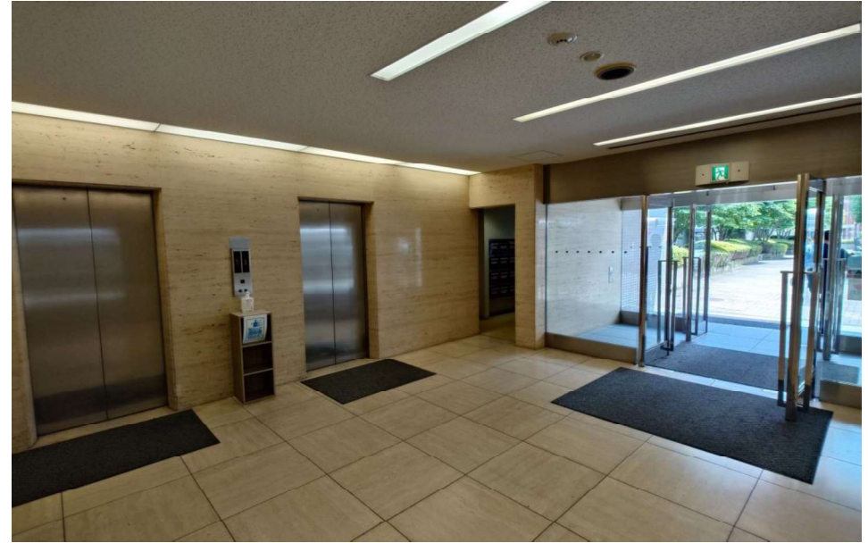
エレベーターホール