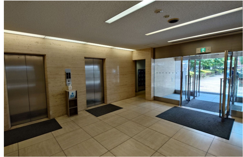
エレベーターホール