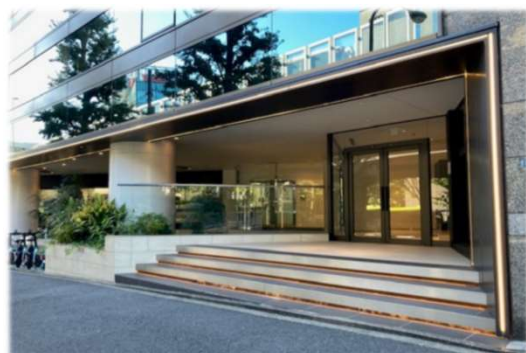
【ビルエントランス】