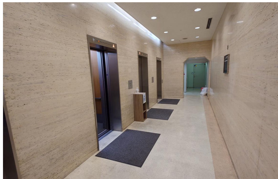
エレベーターホール