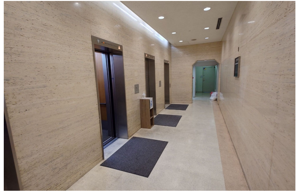
エレベーターホール