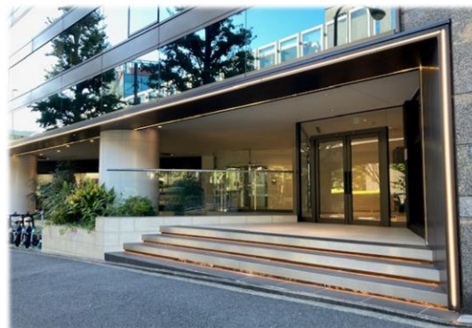
【ビルエントランス】